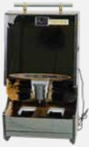
Máy đánh giày