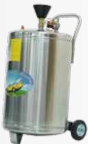
Bình bọt tuyết