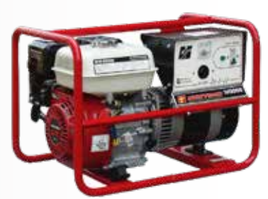
Máy phát điện