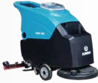
Máy chà sàn