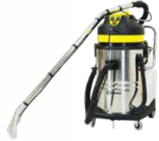
Máy giặt thảm