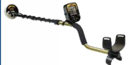
Máy dò vàng