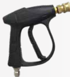
Súng rửa xe