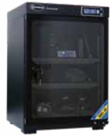
Tủ chống ẩm