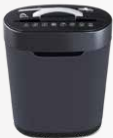
Máy hủy tài liệu