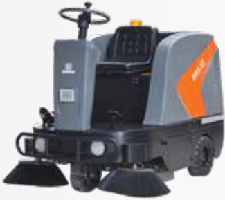
Xe quét rác