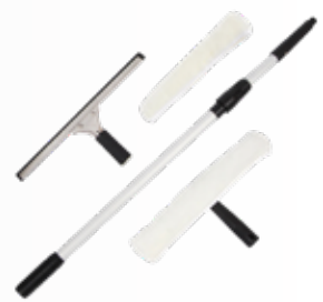
Cây lau kính