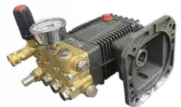
Đầu bơm rửa xe