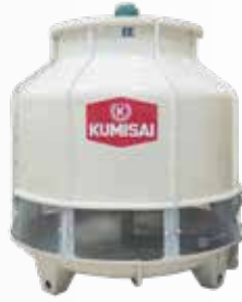
Tháp giải nhiệt