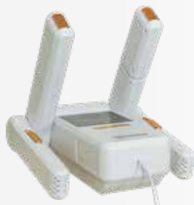
Máy sấy giày