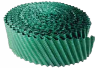
Tấm tản nhiệt