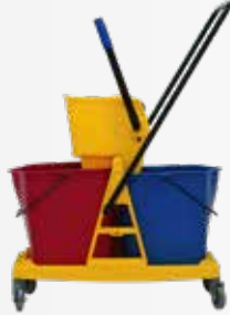
Xe vắt mốp