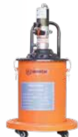
Máy bơm mỡ