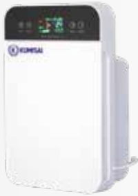
Máy lọc không khí