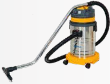
Máy hút bụi