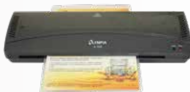
Máy ép plastic