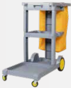
Xe đẩy 3 tầng