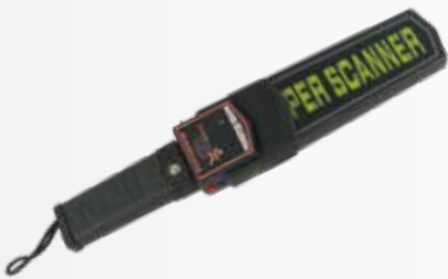
Máy dò kim loại