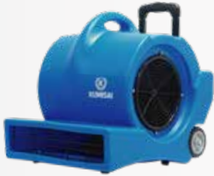
Quạt thổi thảm