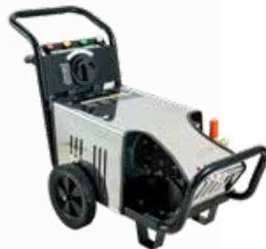
Máy rửa xe