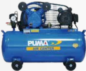
Máy nén khí