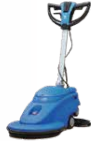
Máy đánh bóng sàn