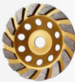
Đĩa mài bê tông