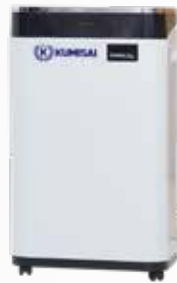
Máy hút ẩm