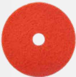
Pad chà sàn